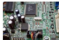
Introducción a Electrotecnia