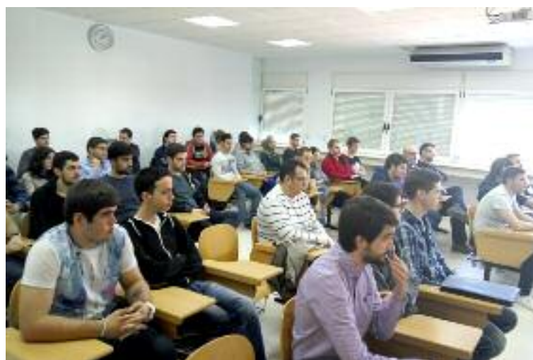
Asistentes a la charla organizada ayer en la Escuela Politécnica de Teruel